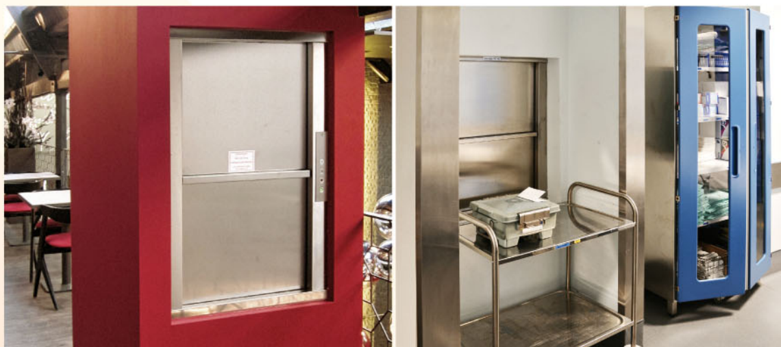
Los elevadores de la serie MH.