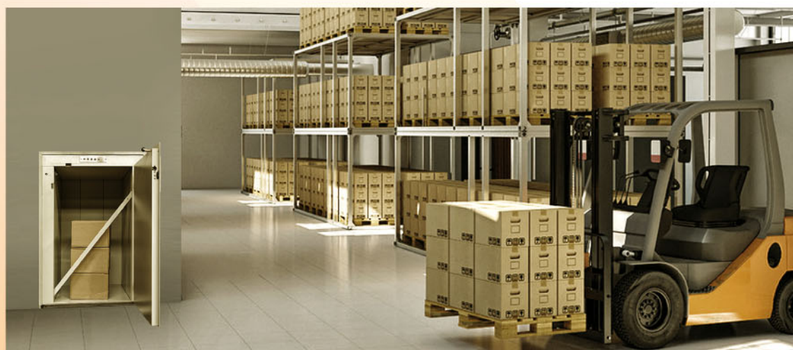
Los elevadores de la serie MTH.

Los elevadores de la series MH y MTH constituyen una gama de montacargas diseñados para el transporte vertical de cargas pequeñas y medias, pensados para facilitar múltiples aplicaciones dentro de los sectores servicios e industrial.